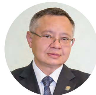
Ирек Файзуллин, министр строительства и ЖКХ РФ:

«Мы видим, что МГСУ уверенно растет по количеству студентов и развивается, становясь своего рода методическим центром для всех архитектурно-строительных вузов. Университет стал участником большой государственной программы «Приоритет-2030», а сейчас готовит заявку на участие в федеральном проекте «Передовые инженерные школы». Все это позволяет выстраивать ключевые базовые процессы: делать образовательные программы более гибкими, развивать в вузах самые передовые технологии и внедрять конкретные продукты на рынок. Наша задача — сделать так, чтобы не только в Москве, но и в регионах менялось качество строительного образования. Мы со своей стороны готовы оказывать коллегам университетов всяческую поддержку».