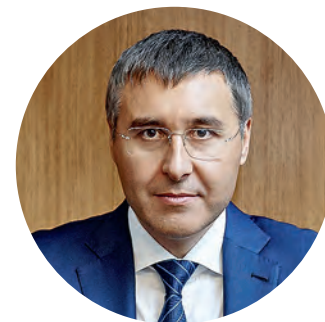
Валерий Фальков, министр науки и высшего образования РФ:

«Перед нами поставлен целый ряд серьезных задач, и одна из главных — это повышение качества образования и управления. В решении этого вопроса МГСУ занимает ведущую роль. Мы должны поднять производительность труда, начиная от высшего образования и заканчивая простой переподготовкой кадров. Здесь мы видим очень большую роль МГСУ как нашего флагмана образования в стране».