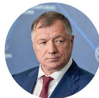
Марат Хуснуллин, вице-премьер Правительства РФ:

«Перед нами поставлен целый ряд серьезных задач, и одна из главных — это повышение качества образования и управления. В решении этого вопроса МГСУ занимает ведущую роль. Мы должны поднять производительность труда, начиная от высшего образования и заканчивая простой переподготовкой кадров. Здесь мы видим очень большую роль МГСУ как нашего флагмана образования в стране».